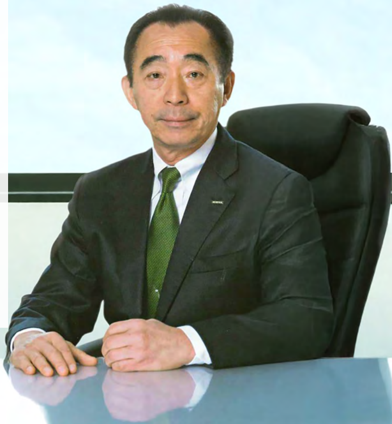
株式会社NIGITA 代表取締役社長